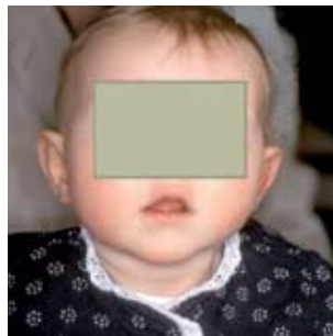
Na behandeling met een splint